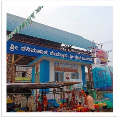
Shani Mahatma Temple, Pavgada

Garuda News interviewed both in Kannada and English, an exclusive, on questions such as: