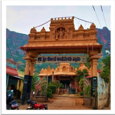
Kote Anjaneya Temple, Pavgada